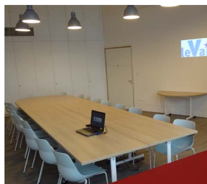
La salle des Souris de 50 m² (réunions, commissions...)