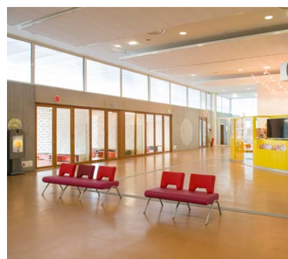
Espace accueil de 300 m² (buffet, conférence, soirée dansante...)