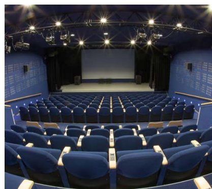
L'auditorium de 140 places (conférences, séminaires, assemblées générales...)

Bénéficiez de tarifs préférentiels dans un lieu unique de réception au cœur des nouveaux quartiers de Strasbourg. Accessible en tramway et voiture (parking 140 places) avec un choix de neuf espaces pour réaliser vos projets :