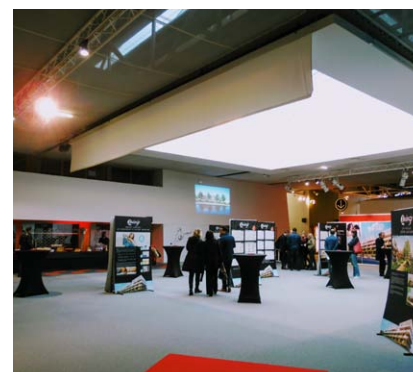
Le hall d'exposition de 250 m² (cocktails, dîners, expositions...)